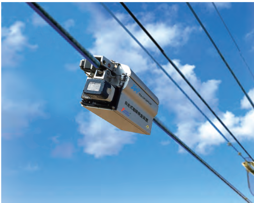
自走式装置完成図