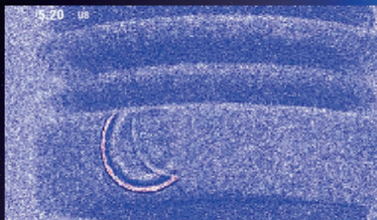
超声波传播动画图像